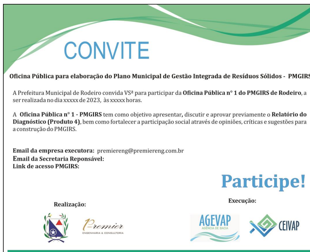
Figura 5 – Modelo de convite para os eventos

A seguir é apresentado um modelo de convite.